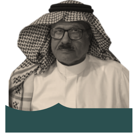
نائب الرئيس الأستاذ/ عبدالله العلي العبيدالله